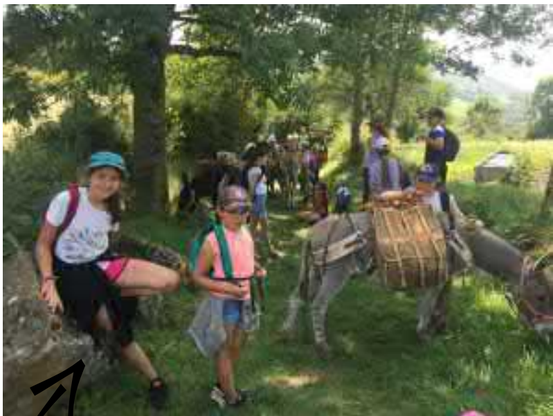
Pause déjeuner au pied de ND du Mont Carmel et on continu le parcours avec toujours des surprises.