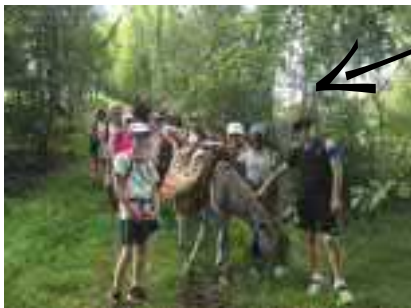
Beau chemin ombragé... un arrêt pour se désaltérer est tout indiqué avant...

...d'affronter un passage technique bien maîtrisé par les quatres équipes et leurs ânes. Apprentissage de lecture de carte IGN et rebouchage de caniveaux pour faire passer Lorette.